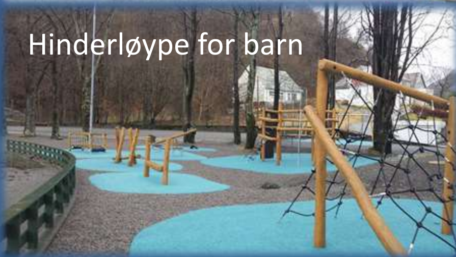
Hinderløype for barn